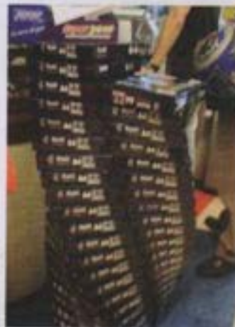
Papel tipo SUZANO Report