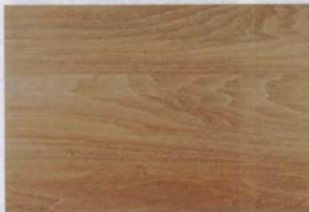
Piso de chontillo (Andira macrothyrsa)