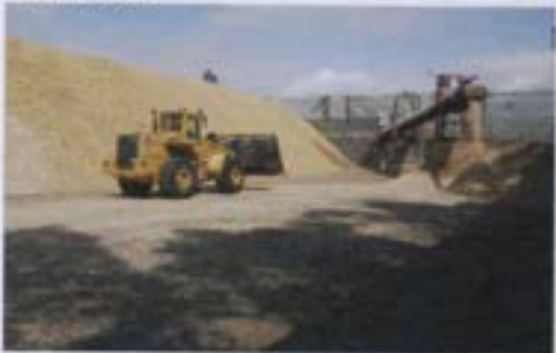
Producción de astillas de eucaliptos