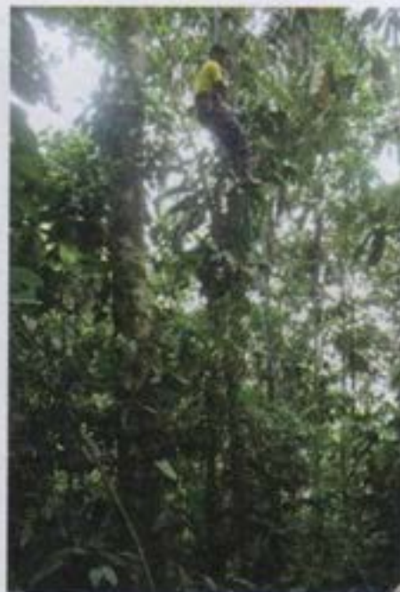
Cosecha con sistema de cables