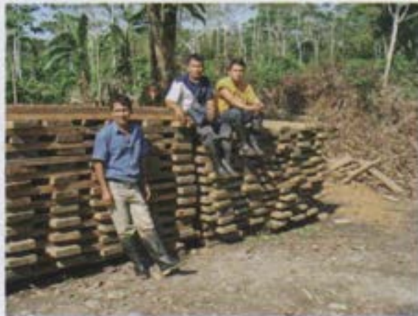
Lugar de acopio de madera