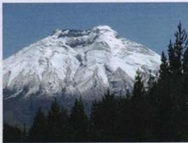
Volcán Cotopaxi y plantaciones de pino