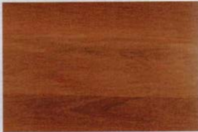
Piso de colorado manzano (Guarea kunthiana)