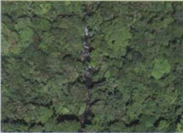
Bosques de la provincia de Morona Santiago