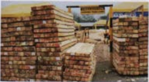
Bultos de madera aserrada