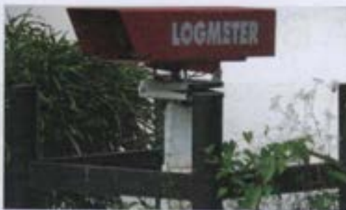
Logmeter: sistema para cubicar la carga de camiones forestales