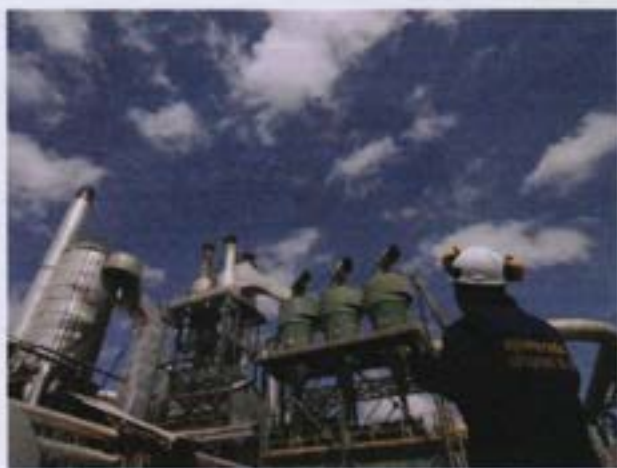
Planta de procesamiento

Aglomerados Cotopaxi aún no se tiene cadena de custodia de sus productos, aunque las plantaciones estén certificadas.