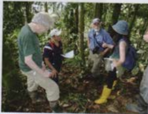
Equipo técnico de Verdecanaadé.