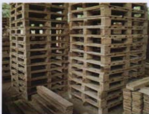
Pallets para consumo propio de las Empresas REYBANPAC RBD C.A.