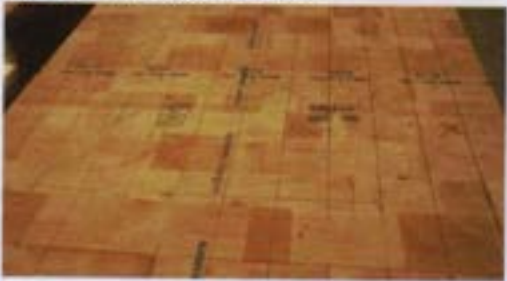
Panel flexible de madera de balsa. Certificado FSC