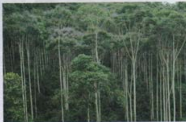
Unidad de plantaciones para manejo