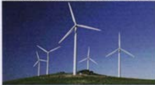
Aspas para energía eólica