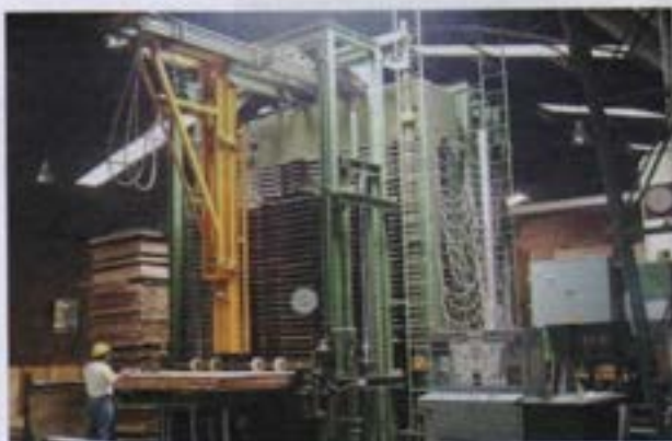
Presna para madera

En 1978, junto a la Fundación Forestal Juan Manuel Durini, se fundó el programa forestal privado más importante de Ecuador: Bosques para Siempre, que impulsa el Manejo Forestal Sustentable (MFS), tanto en el bosque nativo como en las plantaciones del país.