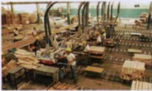
Planta de procesamiento de madera de balsa