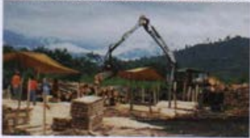
Operación de cosecha