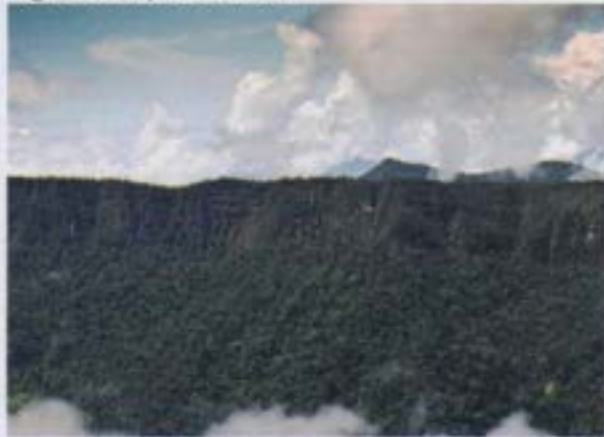
Tepuyes - Cordillera del Cóndor