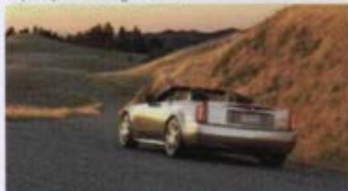
Paneles de tableros de autos