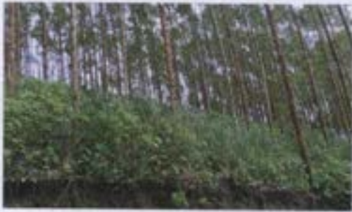
Plantación de eucaliptos