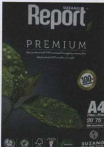
Papel con certificación FSC

El principal proveedor de estas empresas importadoras de papel es SUZANO, empresa brasileña, dedicada a la fabricación de papel.