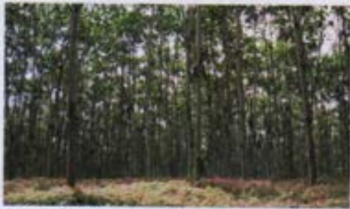
Plantación de balsa de 3 años