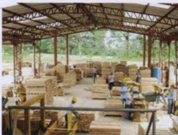
Instalaciones de Reybanpac