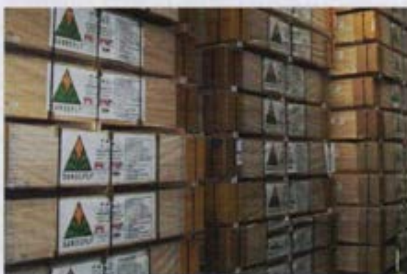
Área de embalaje