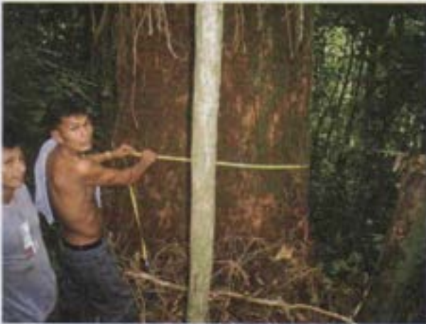
Medición de árboles