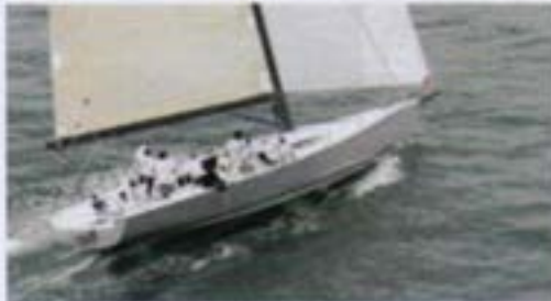
Tableros y pisos de yates, veleros, botes a motor